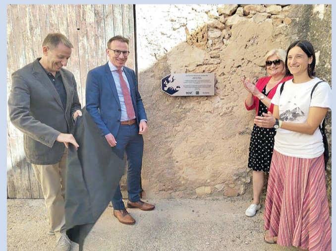
Un moment de la descoberta de la placa commemorativa.

L'antic edifici de l'Hospital de Pelegrins ha rebut el reconeixement de la Societat Europea de Química per la importància històrica d'un procediment químic que va desenvolupar el fill il·lustre d'Altafulla Antoni de Martí i Franquès (1750-1832) per determinar la composició de l'aire atmosfèric.