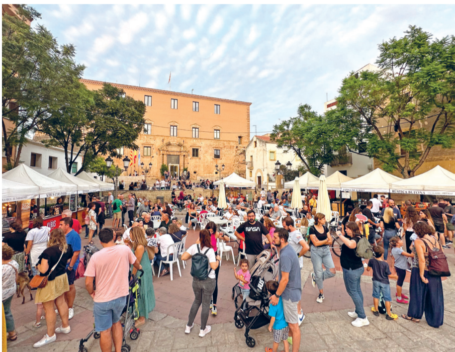
A la fira es podran tastar fins a dotze cerveses diferents.