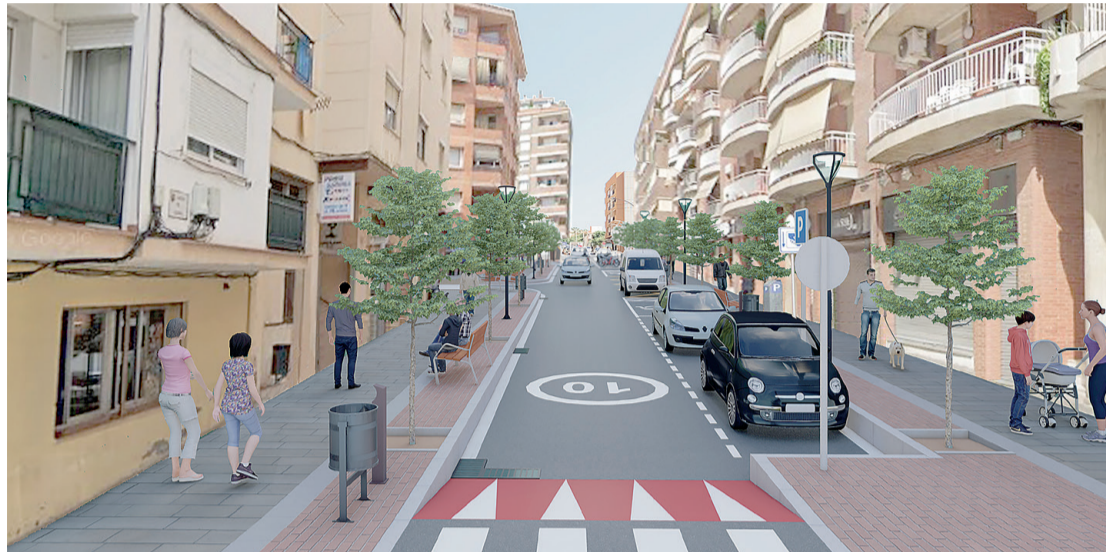
Una de les renderitzacions del projecte.

El projecte, que actuarà sobre una superfície de 1.054 m 2 i té una durada prevista de cinc mesos, inclou la reforma de la cruïlla amb el carrer del Mercat, la millora de les voreres per fer-les més accessibles, amb paviments similars als del carrer de Pere Badia. A més, es reduirà l'espai per al trànsit rodat a una calçada de 3,5 metres, mantenint 2 metres per a l'aparcament de vehicles i ciclomotors, i es mantindrà la bateria de contenidors existent en el tram reurbanitzat. Es col·locarà de nou mobiliari