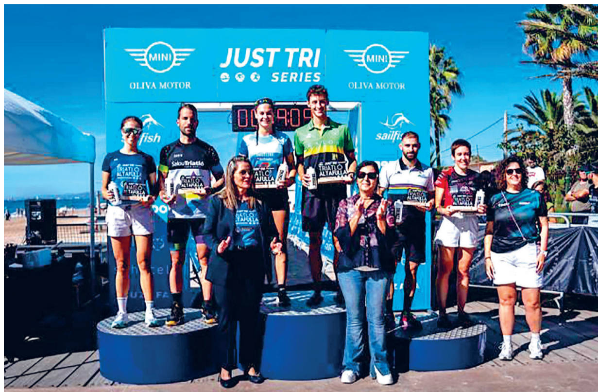
El podi d'aquesta darrera edició del triatló altafullenc.

Els i les atletes van recollir els seus dorsals a la platja d'Altafulla i a partir de les 9.00 hores es va donar el tret de sortida amb la prova Sprint Masculina, seguida cinc minuts després de les sortides Sprint Femenina i la de relleus. Els i les participants van