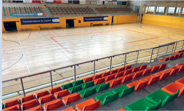
El Pavelló Municipal Sant Jordi ha estat objecte de millores.

S'han realitzat treballs de manteniment a la façana de l'edifici dels vestidors i el bar de la piscina antiga. En total, s'han pintat 677,79 m 2 , cobrint superfícies com la façana, les reixes de ferro, les baranes, els pilars i les portes. A més de la pintura, s'han dut a terme tasques de sanejament per reparar forats i esquerdes, per garantir la durabilitat de