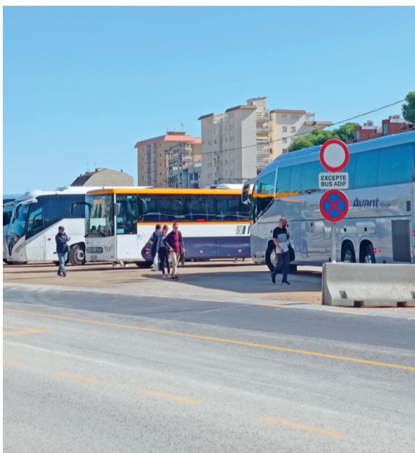
Una imatge de la parada provisional d'autobusos.

Des del passat 1 d'octubre no passen trens per l'estació de Torredembarra a causa de les obres al túnel de Roda de Berà, que duraran cinc mesos i obliguen a tallar el trànsit de trens entre Tarragona i Sant Vicenç de Calders. L'operatiu alternatiu d'autobusos des de l'aparcament habilitat per Adif al costat de l'estació ha emprès l'Ajuntament de Torredembarra a portar a terme algunes actuacions, com la supressió de places d'estacionament per millorar la maniobrabilitat dels busos i pintar nous senyals viaris, i també a demanar millores a l'operador ferroviari.