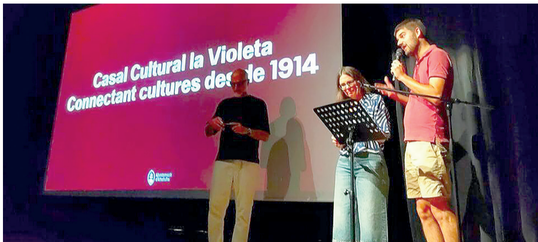
Un moment de la presentació del programa. / AJ ALTAFULLA