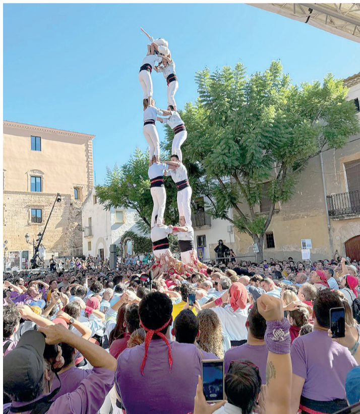
Els Nois de la Torre han carregat el 2de7 per primer cop en 39 anys. / CONCURS DE CASTELLS

El de 5de7a va ser el primer castell de la jornada que han descarregat els Nois de la Torre i en la segona ronda van fer un pas molt important carregant el 2de7, després de 39 anys sense aconseguir-ho. En la tercera ronda van descarregar el 7de7 i van rematar en la cinquena completant el primer el 7de7a de la seva història, una actuació que dels va permetre superar els Castellers de Castelletdefels, que havien descarregat el 5de7a, el 7de7 i van carregar el 4de8 en la quarta ronda després de no aconseguir-ho en l'anterior. Els blau