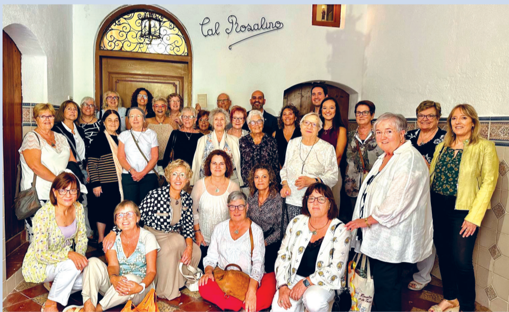
Foto de família de les Rosalies de Torredembarra.

La 28a Trobada de Rosalies es va dur a terme el 6 d'octubre, com cada any, coincidint amb el naixement de santa Rosalia. El programa va començar amb la tradicional missa solemne a l'església de Sant Pere Apòstol, on es troba el Quadre de santa Rosalia , i després, al pati del castell, va tenir lloc l'ac-