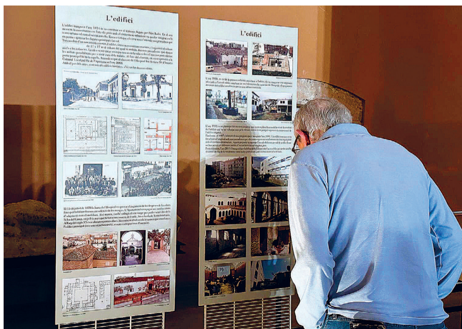
L'exposició es pot veure al pati del Castell.

L'exposició, organitzada per la Fundació Pere Ba-