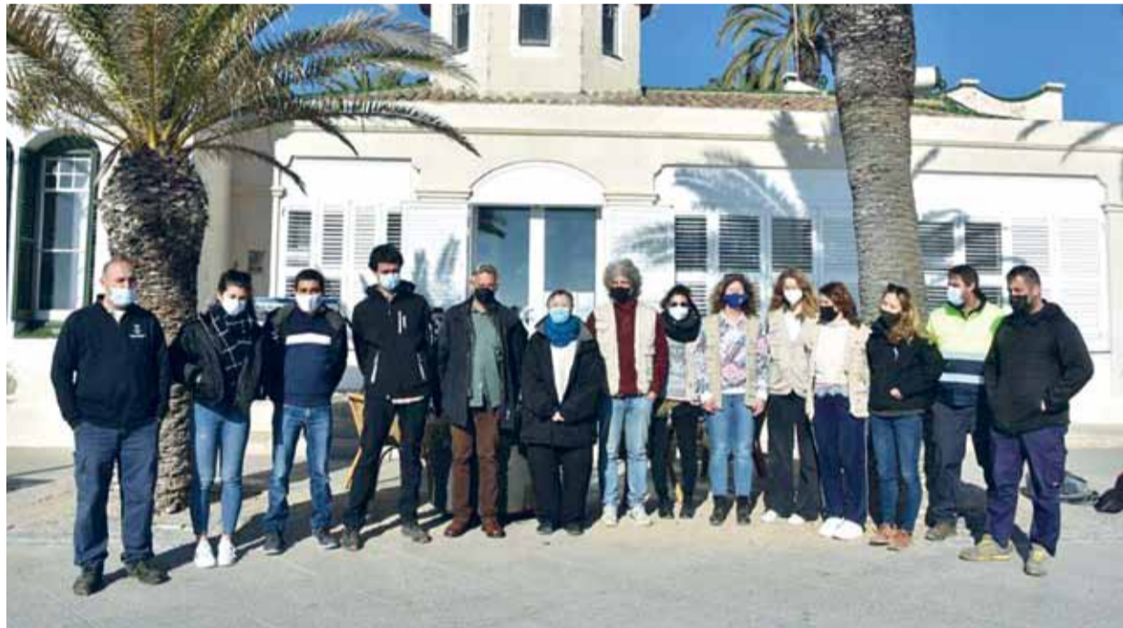
Foto: Imatge de família amb el regidor, tècnic, treballadors i voluntaris. / ANNA F. / AJ. TORREDEMBARRA

Una de les novetats d'enguany és que cada mes es destinarà a una temàtica ambiental: arbrat urbà (febrer), Torredembarra referent de l'estalvi d'aigua (març), l'aire net (abril), la nostra biodiversitat (maig), el medi ambient (juny), els Muntanyans (juliol), les platges i la natura