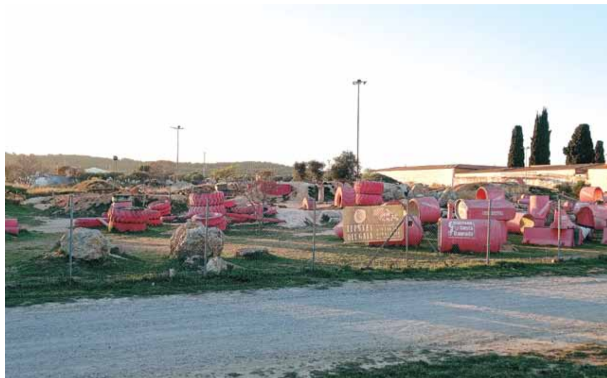
Una imatge del Bike Park Costa Daurada, els terrenys escollits per l'Ajuntament per construir-hi el nou CAP.

L'Ajuntament de Torredembarra aposta per ubicar el nou centre sanitari en uns terrenys municipals al costat de cementiri, tipificats com a zona d'equipaments i on des de l'any 2009 hi ha el Bike Park Costa Daurada. I es que un cop descartada la possibilitat inicial d'ampliar el CAP actual —perquè els terrenys del voltant