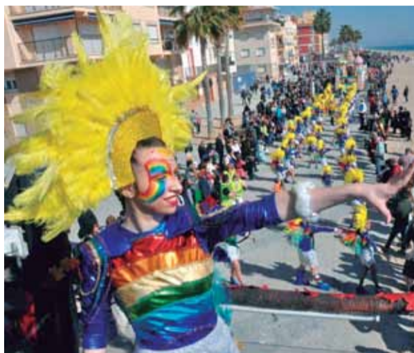
Una imatge del Carnaval de Torredembarra 2020.

L'ús de mascaretes serà obligatori durant tot el recorregut i no es permetrà menjar, beure, ni fumar. En cas de tenir símptomes de Covid-19 o haver estat en contacte amb un positiu, no es