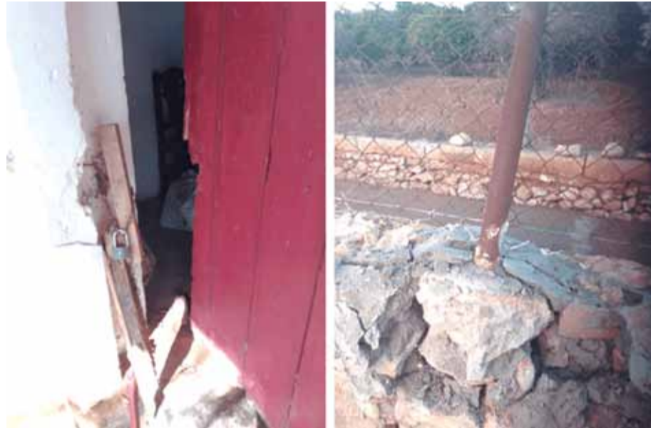
Foto: Desperfectes patits en les propietats dels pagesos durant els assalts. / CEDIDES

Les entrades es produeixen entre les onze de la nit i les cinc de la matinada i en el seu cas només han de saltar un