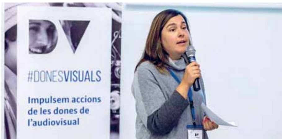
Foto: Belinda Bonan és la directora de Marla & The Guardians of Time , un nou projecte de Most Wanted Studio. / FACEBOOK

" Marla & The Guardians of Time és una sèrie d'animació dirigida a un públic infantil de més de set anys i que tracta dels viatges espai-temps. Hem cregut que era interessant introduir la realitat virtu-