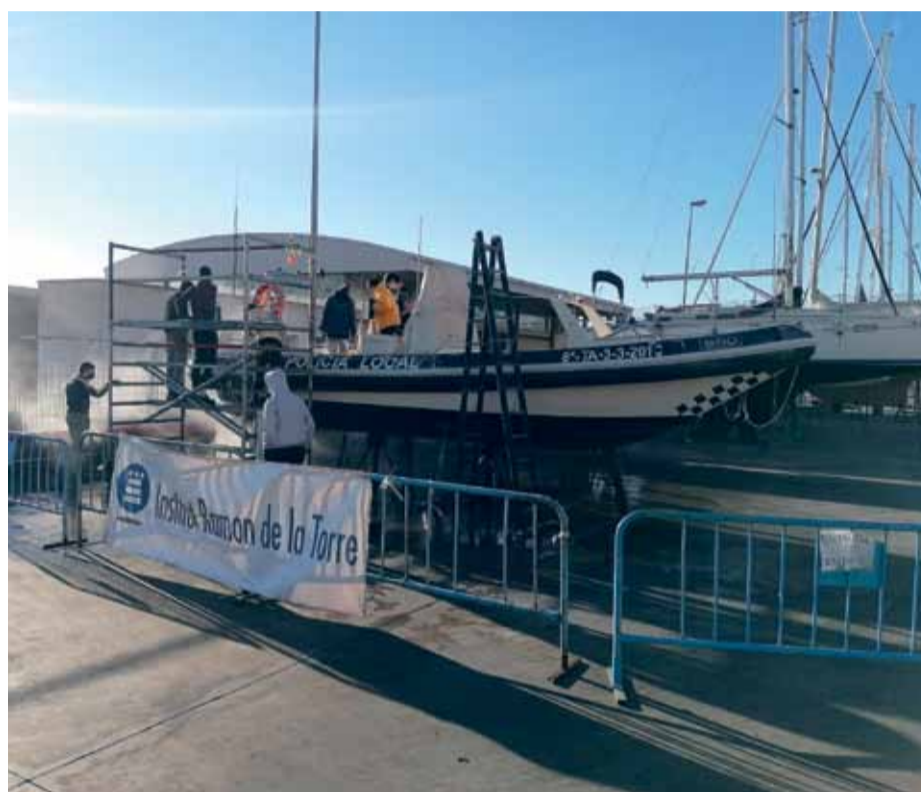
Foto: Alumnes de l'institut torrenc fent les pràctiques al port de Torredembarra. / INS RAMON DE LA TORRE

Des del mes de novembre passat, els quinze alumnes del Programa de Formació i Inserció (PFI) de l'Institut Ramon de la Torre reparen embarcacions a les instal·lacions del port de Torredembarra. Ho fan gràcies a un conveni signat entre el centre educatiu i el Port de Torredembarra, que s'ha marcat com un dels seus objectius en els propers anys potenciar la seva vessant de formació en la reparació i el manteniment i reparació d'embarcacions entre els joves del seu territori d'influència.